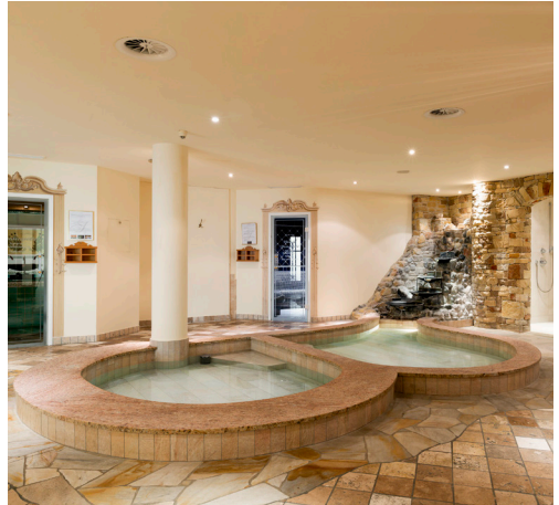
Hotel Singer OG | Fotos: Hotel Singer (Archiv), Alba Belgrave, Alexandra Feisch, The Wartmann Druck-Alpina Druck GmbH